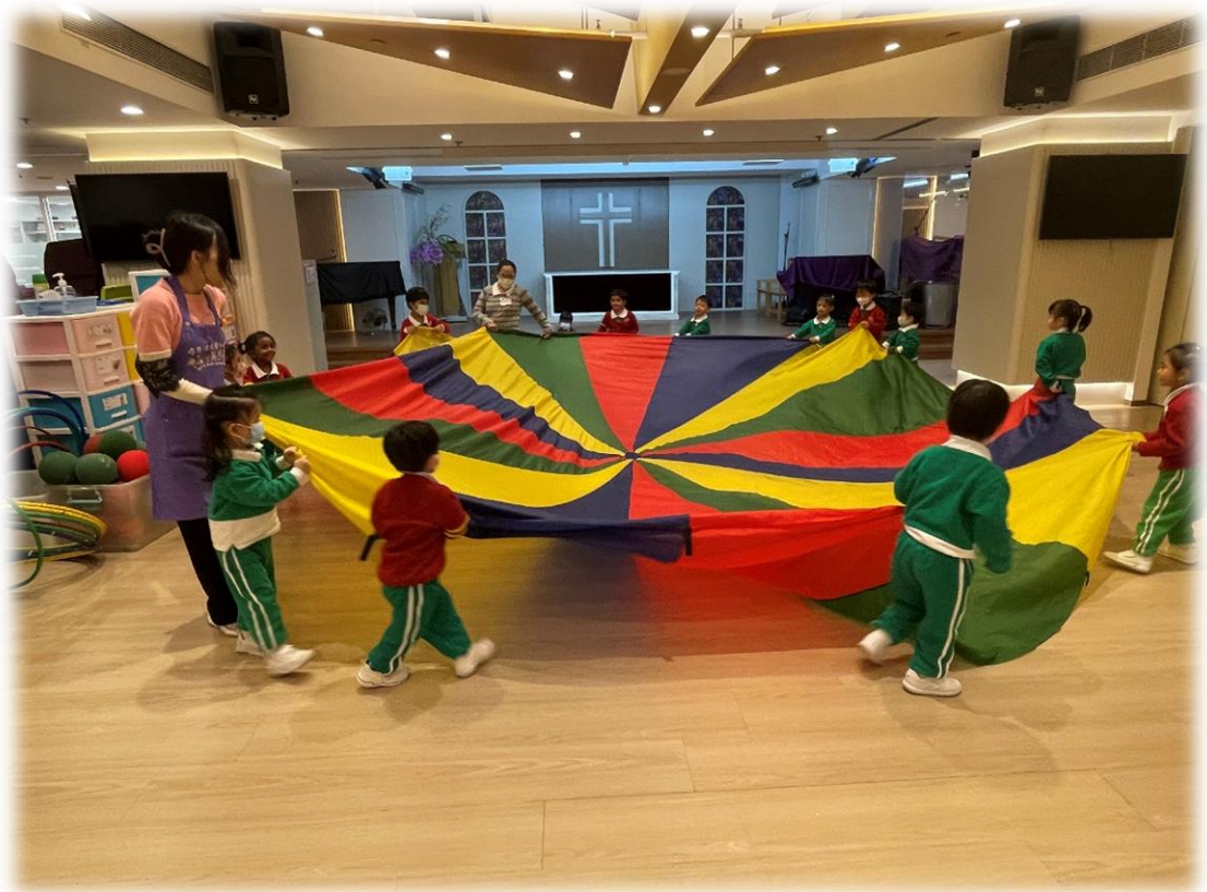
🍓 在音體活動中，我們用彩虹傘來模擬焗超級大蛋糕！